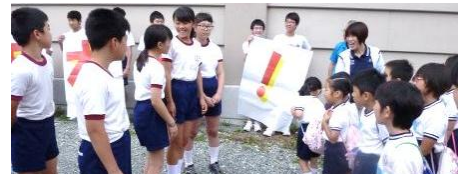
6.7 旭地域の「3校交流学习」の様子