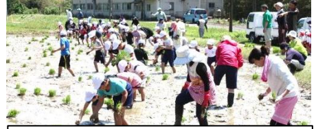
5.10 明木小学校 田植えの様子