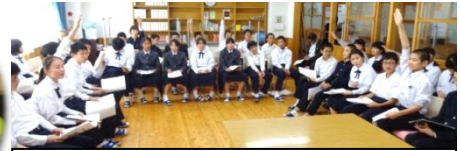
5.24 旭中学校 生徒総会の様子