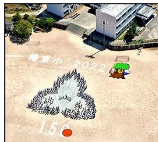
ドローンから見た様子

考えてみれば、新型コロナウイルス感染症の流行とともに、全校児童が一堂に会する機会が失われてきた中、久しぶりに全校で一つのことにチャレンジする貴重な機会となりました。コロナ禍により失われつつある集団行動や協働による達成感の大切さについて、改めて気付かされるとともに、これからの教育活動で補っていかねばならないと痛感したところです。