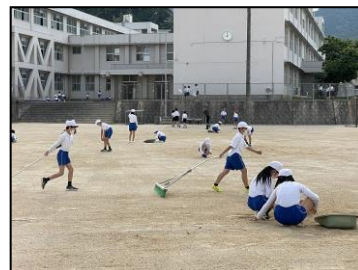
登校して運動場を整備する6年生

こうした行事をとおして、最上級生の役割を果たしながら、個人の成長と椿東小の伝統を継承してほしいと願っています。ありがとう!6年生。