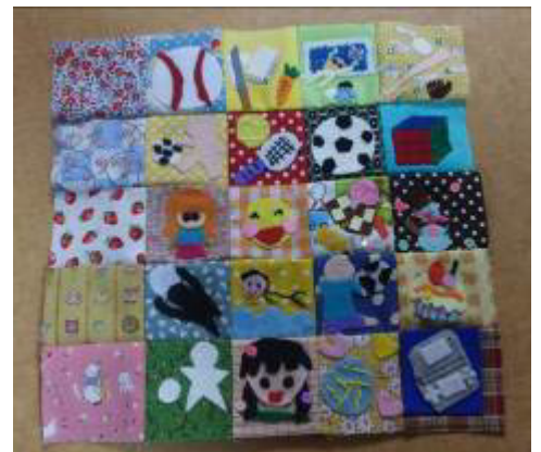
思いのこもった表紙になりました

6年生全員が鹿島小学校のお友達と会ったら何をしたいかを一人一人が図案にし、それをパッチワークしました。一緒にサッカーをしたい、バレーをしたい、また笑顔で太陽の下、遊びたいとどれも思いのこもったものばかりでした。作業を手伝ってくれたキッズボランティアのみんなありがとう！