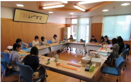
《食券切り分け作業の様子》

通常の花綱会では、卒業生に贈るピカット君のマスコット作りと年2回のエコキャップの集計を行っております。みなさんとおしゃべりしながらの楽しい作業です。ご興味のある方は是非一度のぞきに來られませんか？