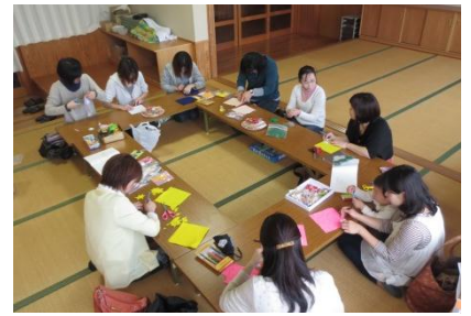
《ピカット君作りの様子》