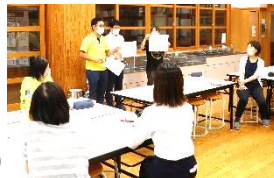
夏季休業中の教職員研修