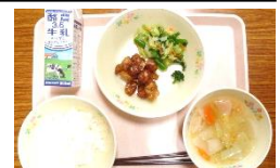
1月19日(木)の献立 牛乳、ごはん、トントンれん こん、こりっこりーサラダ、 冬野菜のスープ