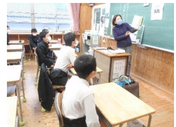
本読み姫の方による読み聞かせ

2月3日（金）から12日（日）の10日間、3学期の読書週間の取組を行います。今回の目的は、「親子で読書の時間を持つことで、読書の楽しさを味わうことができます」です。お仕事等でお忙しいかと思いますが、少しの時間でもよろしいので、子供たちと一緒に読書を楽しむ時間をつくっていただきたいと考えています。ご家庭でのご協力をお願いします。