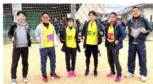
萩市民駅伝の応援 ありがとうございました 59分43秒 19位(40チーム中)