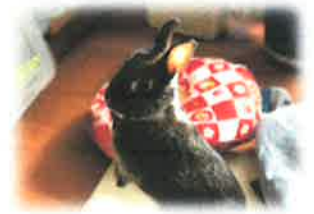
↑ ほう カワイイ