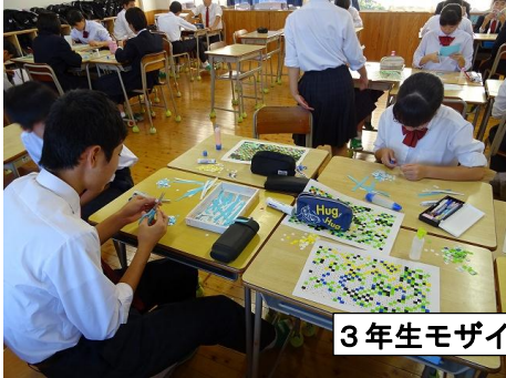
3年生モザイクアート・劇