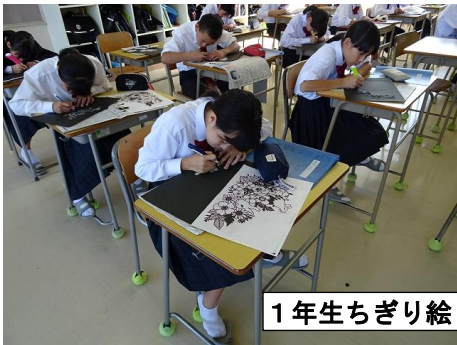
1年生ちぎり絵・和紙とうろう

いよいよ明日28日(日)が文化祭となりました。今年の文化祭テーマは「麗」(うららか)。生徒一人ひとりが晴れ晴れとした麗らかな未来に向かって大きく飛翔してほしいという意味があります。わずか1週間しかない文化祭週間ですが、短い時間にぎゅっと凝縮した活動を行ってきました。明日は、ご家族そして多くの地域の方々に、生徒一人ひとりの姿や作品から「麗らか(うららか)」を感じていただければと思います。また、今年も多くのごの会・保護者の皆様の御協力でPTA主催のバザーを行います。すでに予約販売は終わっていますが、当日券も用意しておりますので、ぜひバザーの売り上げに御協力ください。お待ちしております。