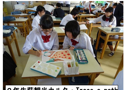
2年生萩観光カルタ・Trace a path