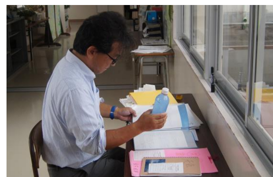
↑ 古田先生：科学作品を評価している様子