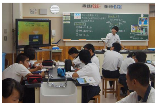
↑ 3年理科：ICTを活用して授業している様子