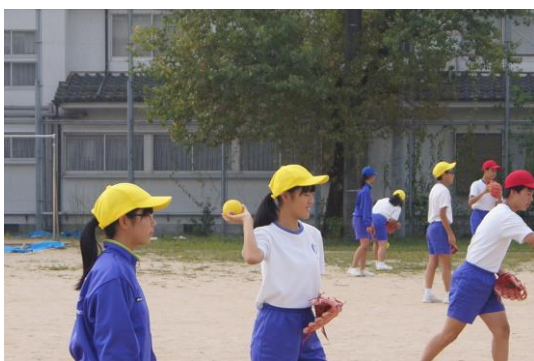
↑ 3年保健体育：ソフトボールをしている様子