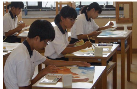
↑ 2年美術：平面制作に取り組む様子