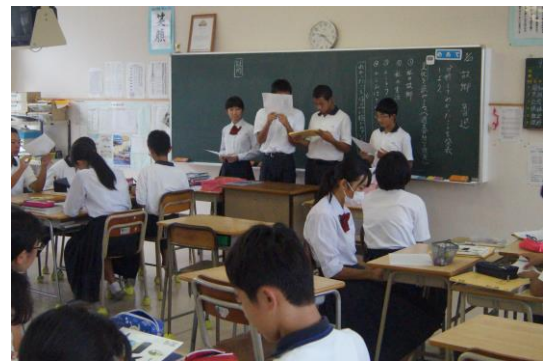
↑ 3年国語：グループ発表している様子