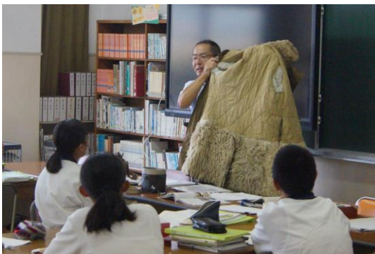
↑ 1年国語：戦争の遺留品を紹介している様子

伝説を作った体育祭も終わり、先週から本格的に通常の授業が行われています。授業づくりは教員にとって最も力を入れて取り組む仕事であり、授業は教員と生徒が一緒になって作り上げていくものです。勉強の秋です。学力の向上に向けて、菫東中一丸となって取り組んでいきます。なお、授業のことや子供たちの様子について、お気づきがあればご遠慮なくご相談ください。