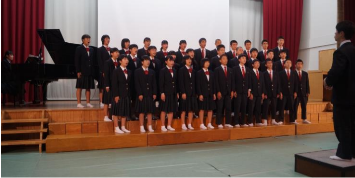
↑ クラス合唱 (特賞：3年2組)

10月27日に、第23回文化祭が行われました。担任、生徒が心を一つにして取り組んだ合唱コンクールや、各自がコツコツと細かい作業を行って完成した学年展示、会場を笑いや感動で一杯にした学年劇等が披露されました。また、昼休みには、PTAやてごの会の方々によりバザーが実施され、楽しい時間を過ごすことができました。生徒一人ひとりの心に、大きな花が咲いた文化祭になりました。