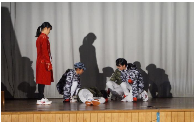
↑ 3年劇「旅立ちの朝に」