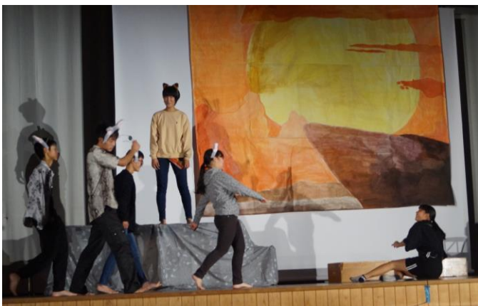
↑ 2年劇「ライオンキング」