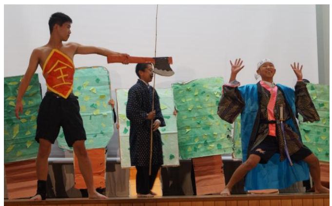
↑ 1年劇「もう一つの童話の世界～珍喜劇～」