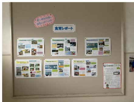
食育レポート (第1校舎東階段スペース)