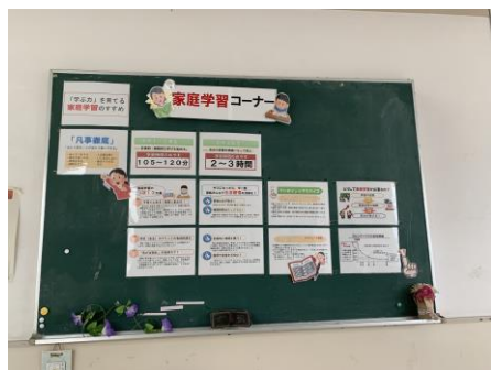
家庭学習コーナー (渡り廊下2階)

今年度は参観日等が設定できず、保護者に来校いただく機会がなくなっています。今回は、担当教員が力を入れて取り組んでいる掲示物を紹介します。なお、教室は、担任がそれぞれ工夫を凝らした学級掲示を行っています。11月は、今年度初めての授業参観（人権参観日）を計画しています。ご来校されたときは、ぜひ掲示物も見ただけたらと思います。