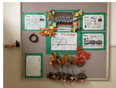
生徒会コーナー (第1校舎西階段スペース)