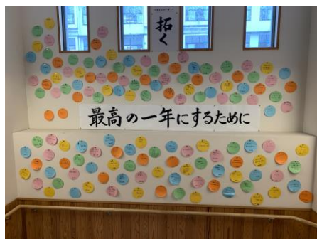
3年生みんなの決意 (新校舎階段スペース)