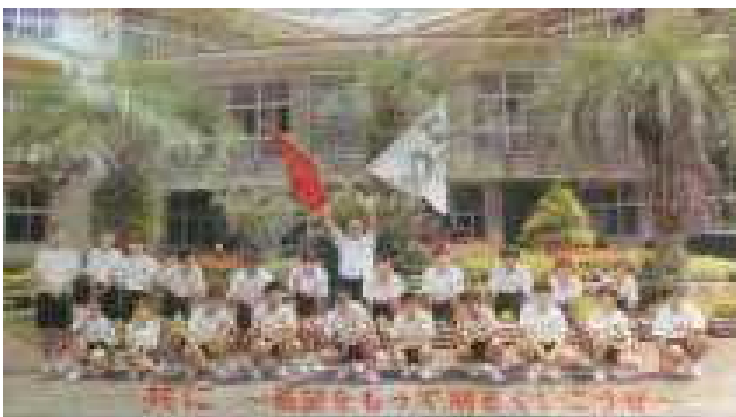
<約65万の点描からなるモザイクアート>