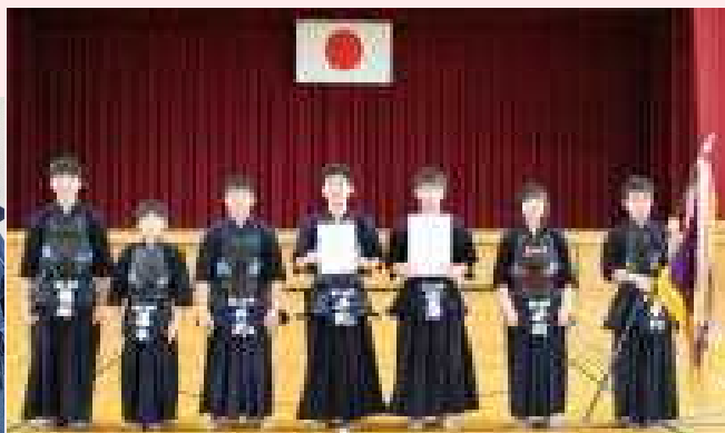
<写真左> 女子個人3位入賞の■■■■さん