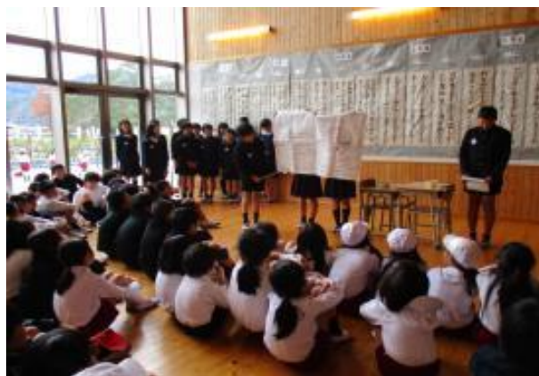
12月12日（月）給食委員会による発表会