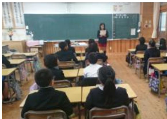
保健委員による各教室でのノーメディア呼びかけ

12月12日（月）の昼休み、明倫ホールで「食事中的姿勢を良くすることの大切さ」などをアピールする発表会が行われました。集まった児童や教職員が見守る中、「個食」や「ながら食べ」が原因で姿勢が悪くなることなどが分かりやすく伝えられ、関心の高まりが見られました。