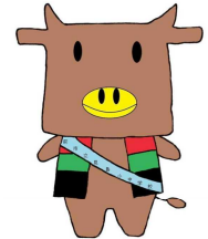
見島小学校・中学校 マスコットキャラクター 「みしまうくん」

み・・・認め合い支え合う子（豊かな心） し・・・心身共に健康な子（健やかな体） ま・・・学びあい高め合う子（自ら学び続ける見島っ子）