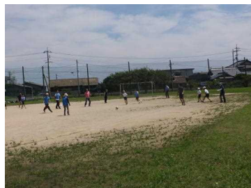
地域・保護者と一緒にサッカー （昼休み）