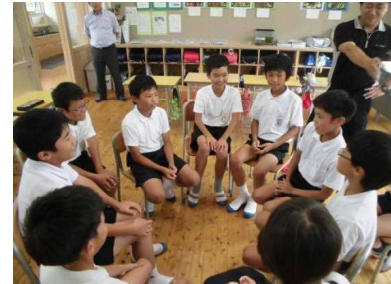
グループ学習する見島の児童