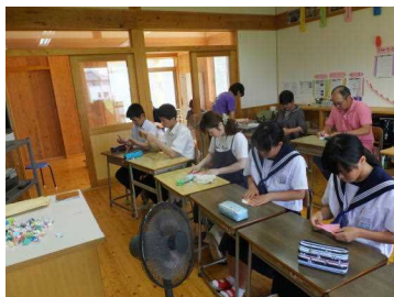
地域・保護者と一緒に学習 （中学校数学）

子どもに戻って児童生徒と一緒に授業を受けたり、掃除をしたり、給食を食べたり、昼休みに遊んだりしていただきました（昨年度までの「学校へ行こうの日」「授業を受けようの日」を合わせて実施しました）。児童生徒はいろいろな人と話したり、汗を流したりすることを通じ、多様な考えを知ったり、意欲を高めたりすることができたようです。今回は学習内容が難しい中学校の授業への参加も多くありました。13名の地域や保護者の皆さん、ご協力ありがとうございました。