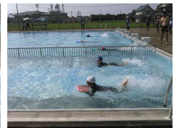
ビート板で泳ぎます