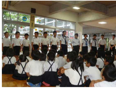
対面式で自己紹介する見島の児童生徒