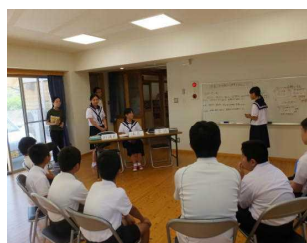
中1女子による進行