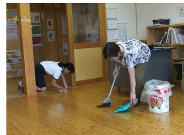
地域の方と一緒に清掃活動 （清掃の時間）