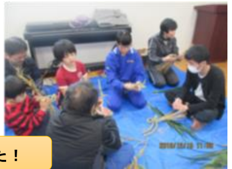
見島伝統のしめ縄づくりに挑戦しました！