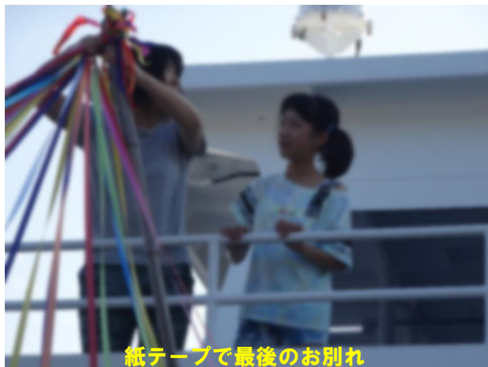
紙テープで最後のお別れ