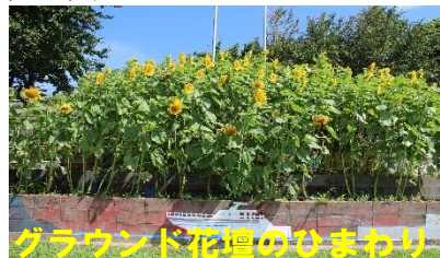
グラウンド花壇のひまわり