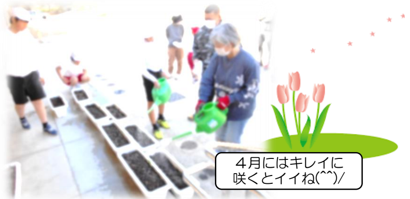
4月にはキレイに咲くといいね(^^) /