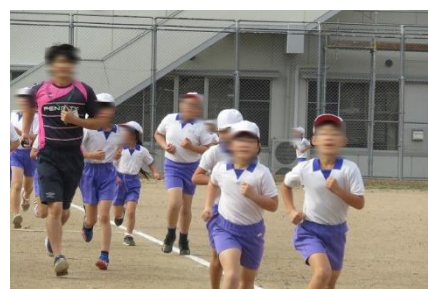
練習も必死で走る子どもたち

11月から、子どもたちは、体育の時間や業間時間などに、持久走の練習を積み重ねてきました。自分の記録に挑戦する子ども、自分のペースをつかむ練習を繰り返している子ども、苦しくなっても負けない気持ちをもてるよう気持ちをコントロールすることを考えていた子ども、心を込めて応援する子どもなど、自分の目標をしっかり決めて取り組む様子が見られました。そのため、練習のときもだれもが真剣に走っていて、かっこいいなと思って見ていました。