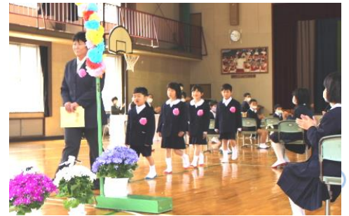
<4月8日(水) 入学式より>

私たちの体が今まで食べたものと飲んだものでできているように、私たちの思考や物事のとらえ方は、これまで触れてきた情報でできている。