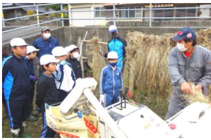
10月28日 脱 穀