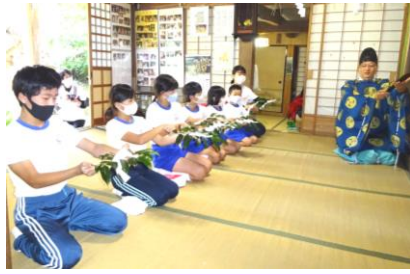
10月9日 地域探訪遠足