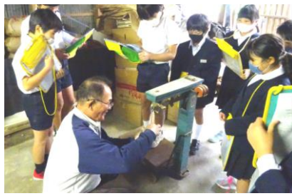
11月4日 籾摺り・精米