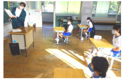
10月20日 育友会の読み聞かせ