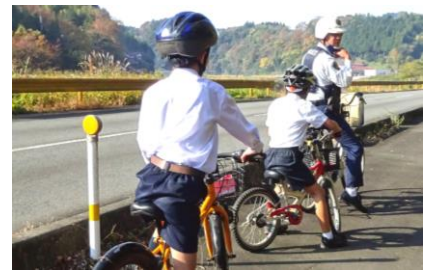
11月18日 3・4年交通安全教室