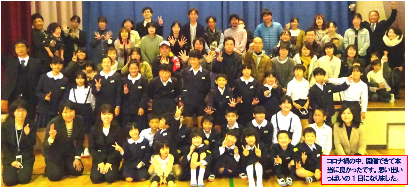
コロナ禍の中、開催できて本当に良かったです。思い出いっぱいの日になりました。

積み重ねた練習の成果を十分に発揮して、堂々と発表する子どもたち。一人一人みんなが主役となって輝きました。パック詰めで頂戴したお餅も最高の味わい。ご支援ご協力をいただいた全ての皆様に深く感謝申し上げます。大変有り難うございました。