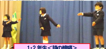
1・2年生<詩の暗唱>動作を交えて、元気はつらつ。