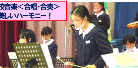
全校音楽<合唱・合奏>美しいハーモニー！