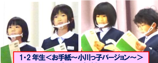
1・2年生<お手紙～小川っ子バージョン～>とても可愛い音読劇でした。