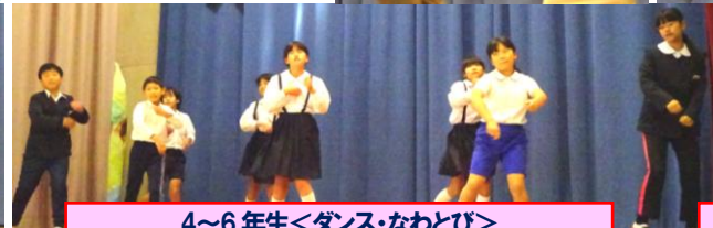
4～6年生<ダンス・なわとび>自主的に発表する子どもは、本当に素晴らしい。