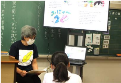
読み聞かせ（田万川更生保護女性会）