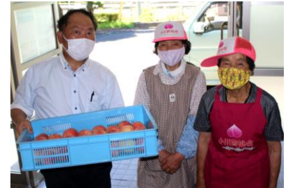
桃のプレゼント（小川育桃会の皆様）