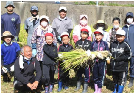
10/5(火) 全校児童 稲刈り:JA 女性部・保護者の方々と