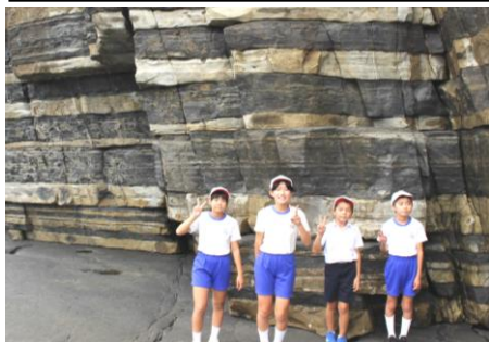
10/19(火) 5年生 地域探訪〈ホルンフェルス・高山〉