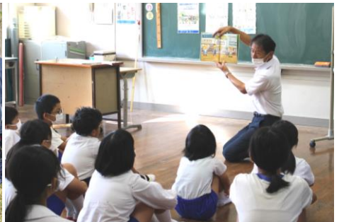
10/8(金) 男女共同参画事業 お父さん・おじいちゃんの読み聞かせ