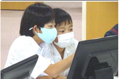
10/21(木)・22(金) 1～4年生の社会見学