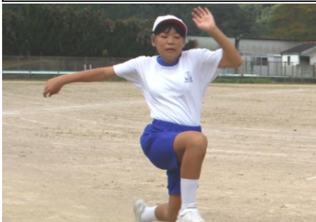
10/11(火) 5・6年生 校内陸上記録会〈走り幅跳び〉