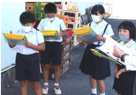
10/4(月) 3・4年生 スーパーマーケットの調査・見学