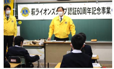
萩ライオンズクラブ《薬物乱用防止教室》