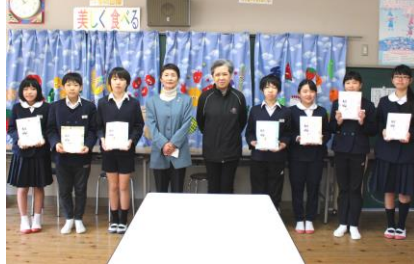
田万川更生保護女性会からの贈り物