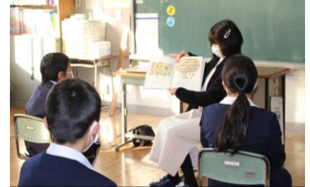
今年度最後の保護者：読み聞かせ