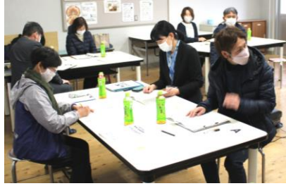
学校運営協議会での意見交換