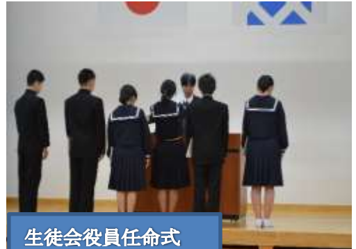
生徒会役員任命式

僕は今年、「したい」が「できる」ような生徒会をつつていきたいです。少ない人数ですが、良い学校になるよう、皆で頑張ります。