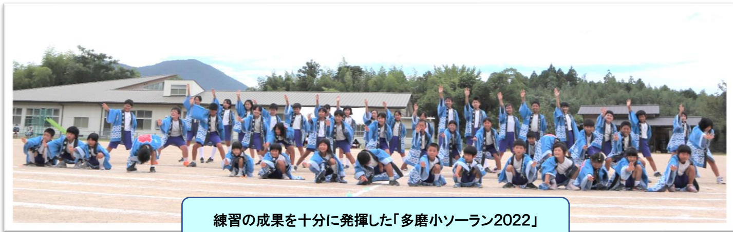
練習の成果を十分に発揮した「多磨小ソーラン2022」

運動会は、一人一人の真剣に取り組む姿が、とてもキラッと輝く素敵な一日となりました。保護者の皆様、最後まで子ども達への温かいご声援、本当にありがとうございました。