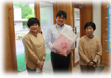
小川婦人会代表の皆さん