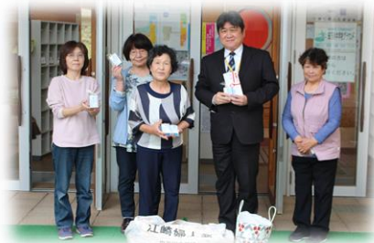
江崎婦人会代表の皆さん

今年も小川婦人会、江崎婦人会の代表の方が来校され、生徒へのお心遣いと雑巾・タオルをいただきました。子どもたちの活動のために活用させていただきます。